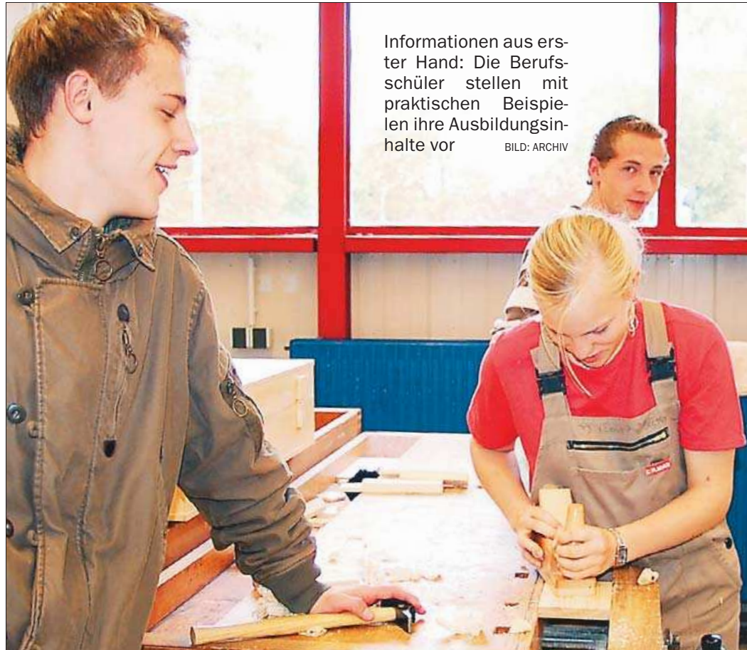
Informationen aus erster Hand: Die Berufsschüler stellen mit praktischen Beispielen ihre Ausbildungsinhalte vor

Für die Schülerinnen und Schüler wird eine Bewerber-