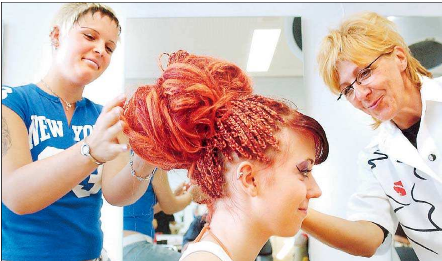
Auf der Berufsfindungsmesse wird über mehr als 120 Ausbildungsberufe informiert. Friseurin ist einer davon.

BERUFSFINDUNGSMESSE Aussteller informieren über mehr als 120 Ausbildungsberufe