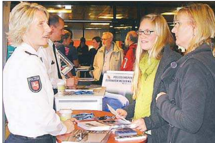
Die Polizeiinspektion Cuxhaven/Wesermarsch informiert auf der Berufsfindungsmesse über berufliche Ausbildungs- und Aufstiegsmöglichkeiten im Polizeidienst.